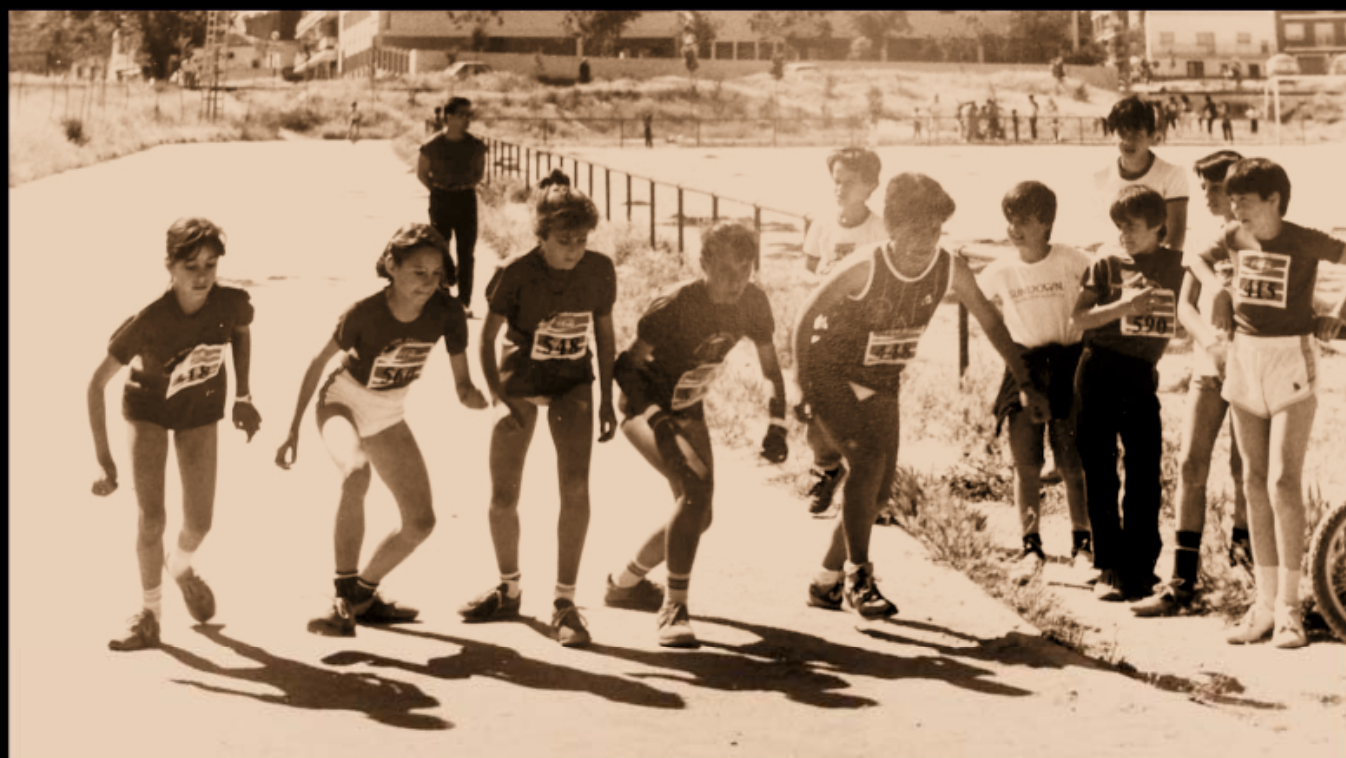
CAMPO "LA VÍA" | ABRIL 1981